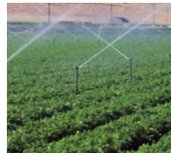
Решения для оросительных систем: SONOCELL и SONOKIT