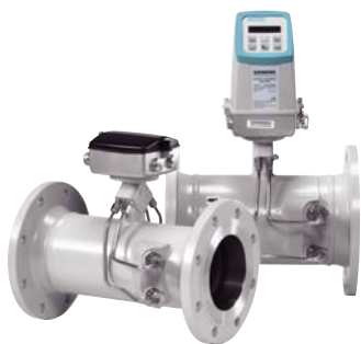
SONO 3300 предлагает наилучшее соотношение «цена / производительность»