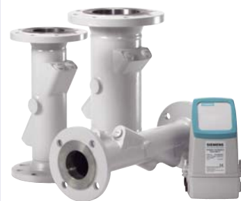
SONOCAL 3000 в сочетании с вычислителем тепла SITRANS F US 105 предлагает экономичные решения