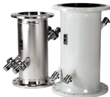
SONO 3100 идеально подходит для применений, в которых проблемой является образование накипи