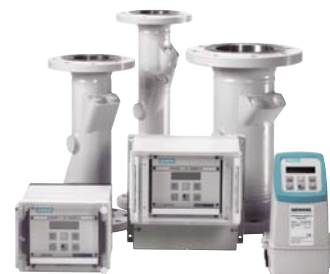
SONO 3300/3000 CT предлагает гибкие решения для измерения расхода индивидуальному заказу