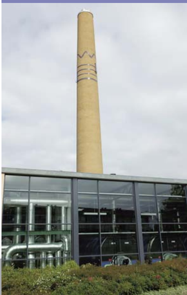
Системы централизованного теплоснабжения: SONO 3300/3000 CT, SONOCAL 3000 и SONOKIT