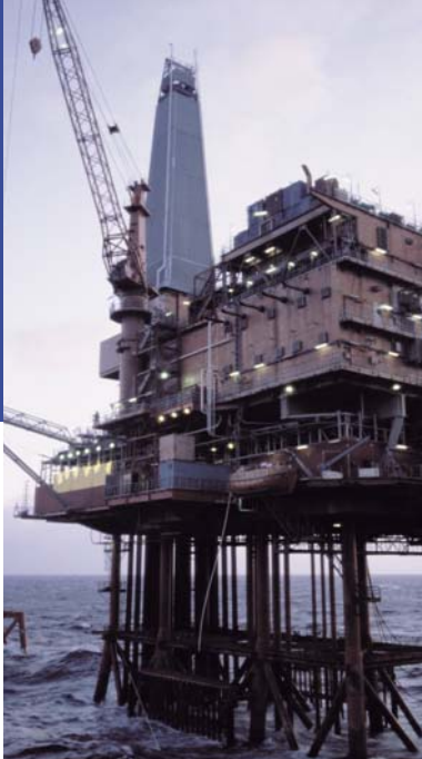
Промышленные решения: SONO 3100, SONO 3300 и SONOKIT